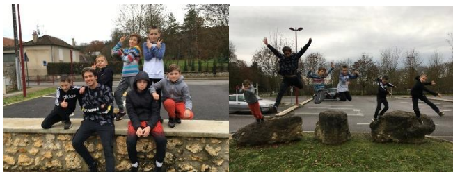
Des élèves du cours de Parkour de Reuil en Brie

GAZETTE N°2 Le journal d'information à destination JANVIER 2021 des habitants de Reuil-en-Brie