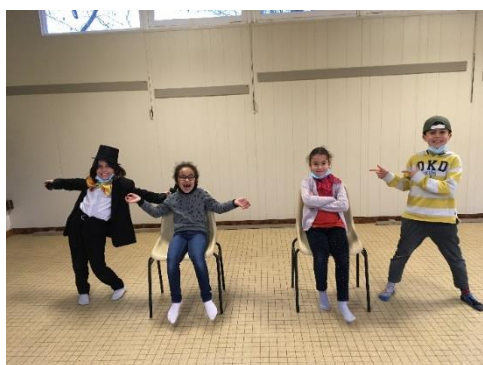
Les élèves du cours de Théâtre de Reuil en Brie

Les cours de théâtre pour enfants ont lieu les mercredis après-midi au foyer de l'amitié. Les élèves y apprennent à jouer, mettre en scène, mimer, danser.