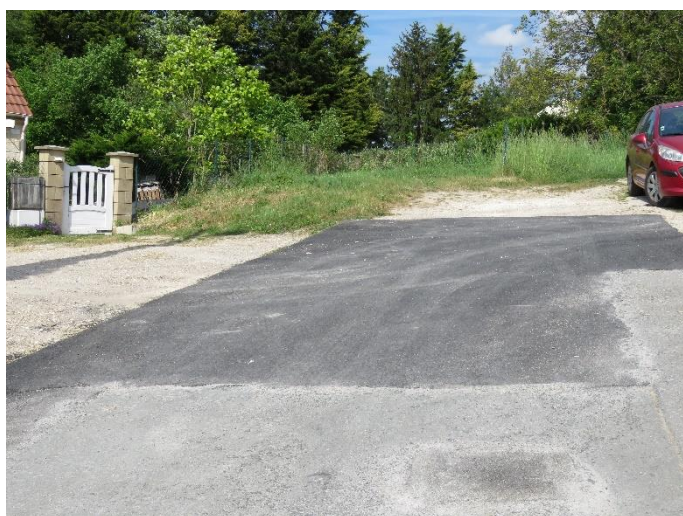
- Rue des Carrières - 10 Mai 2022