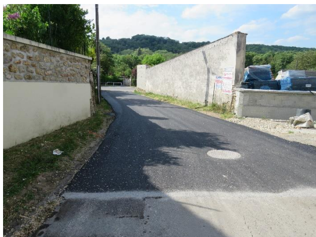
- Rue du Tillet - Bas de la côte - 10 Mai 2022