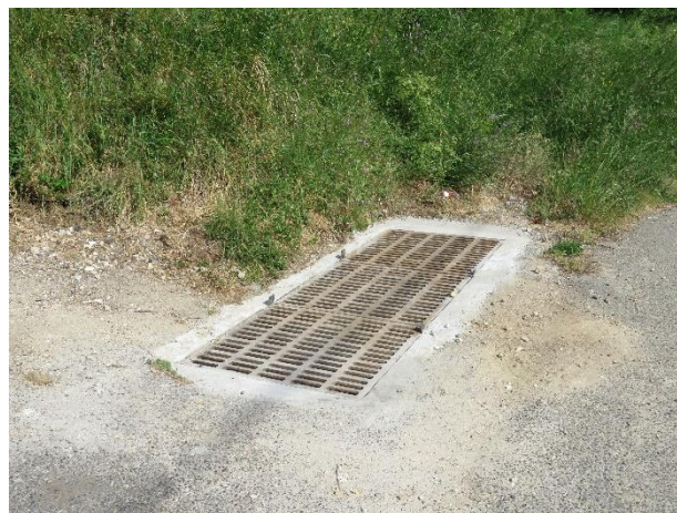
- Rue du Tillet - Évacuation Eaux Pluviales - 10 Mai 2022