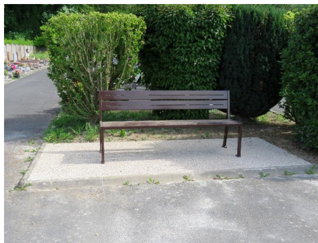
- Cimetière - 10 Mai 2022