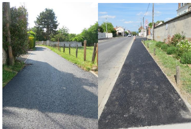
- Rue des Poupelins -