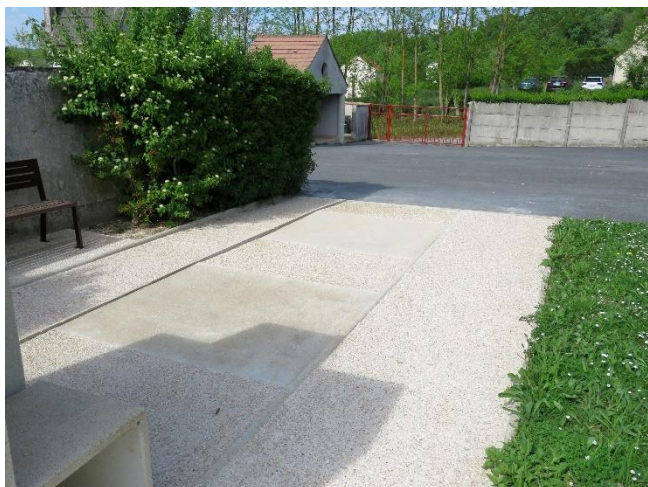
- Cimetière - 10 Mai 2022