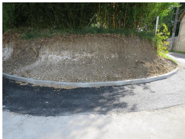
- Angle Rue du Tillet et Rue Pasteur Carrières - 10 Mai 2022